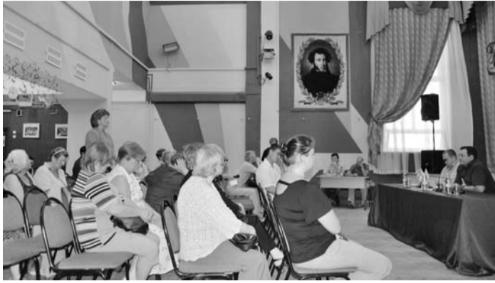
Начало на стр. 1.

Здесь также были решены проблемы водоотведения, произведен ремонт и замена малых архитектурных форм, уложено современное покрытие «Мастерфайбр» на основе резиновой крошки.