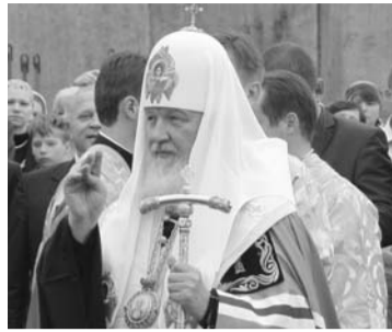
Подготовила Наталия ТАТАРЧЕНКО.

На фото: Патриарх Московский и Всея Руси Кирилл проводит освящение закладного камня строящегося в Александровке православного храма Благоверного князя Александра Невского. 14 июня 2012 года.