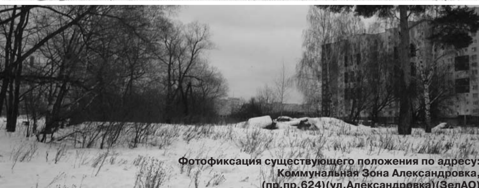
Фотофиксация существующего положения по адресу: Коммунальная Зона Александровка, (пр. пр. 624) (ул. Александровка) (ЗелАО)

На публичные слушания представляется проект планировки земельного участка под строительство за счет инвесторов объекта - физкультурно-оздоровительного комплекса (ФОК), расположенного по адресу: коммунальная зона "Александровка" (пр. пр. 624, ул. Александровка).