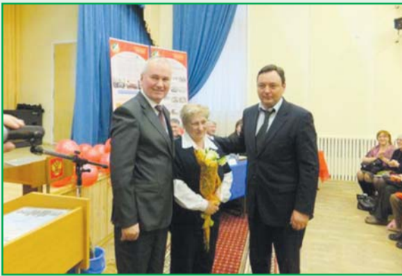
Начало на стр. 1.

В 2012 году в рамках программы благоустройства и приведения в порядок подъездов жилых домов было отремонтировано 140 подъездов на сумму 27 697,107 тыс. рублей, в том числе на средства бюджета - 23 839,151 тыс. руб., средства управляющих компаний - 3 857,956 тыс. руб.